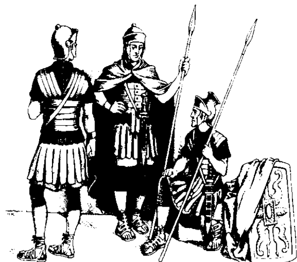
Soudor do Rum (19.2)

6 Om soira'ddi nokito di piro-piro boyoon dot imam om i madtatamong i Yesus, om pomogiak no iyolo' do,